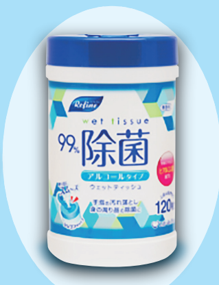
除菌ウエットティッシュ