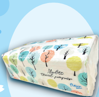
いろいろ使えるキッチンタオル